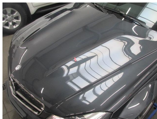
2. Motorhaube Steinschlag smartrepair