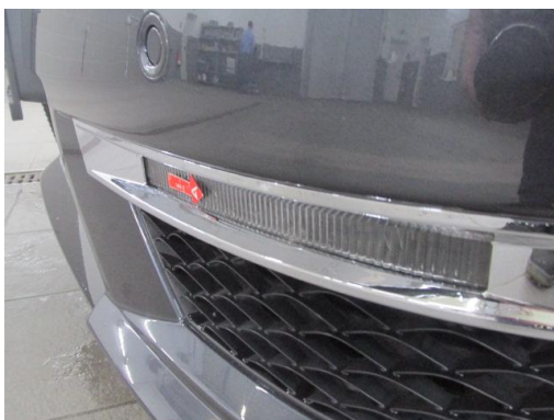
1. Sonstiges Tagfahrleuchte Links u. Rechts beschädigt

Hierbei handelt es sich um kein technisches Funktionsprotokoll bzw. -gutachten.